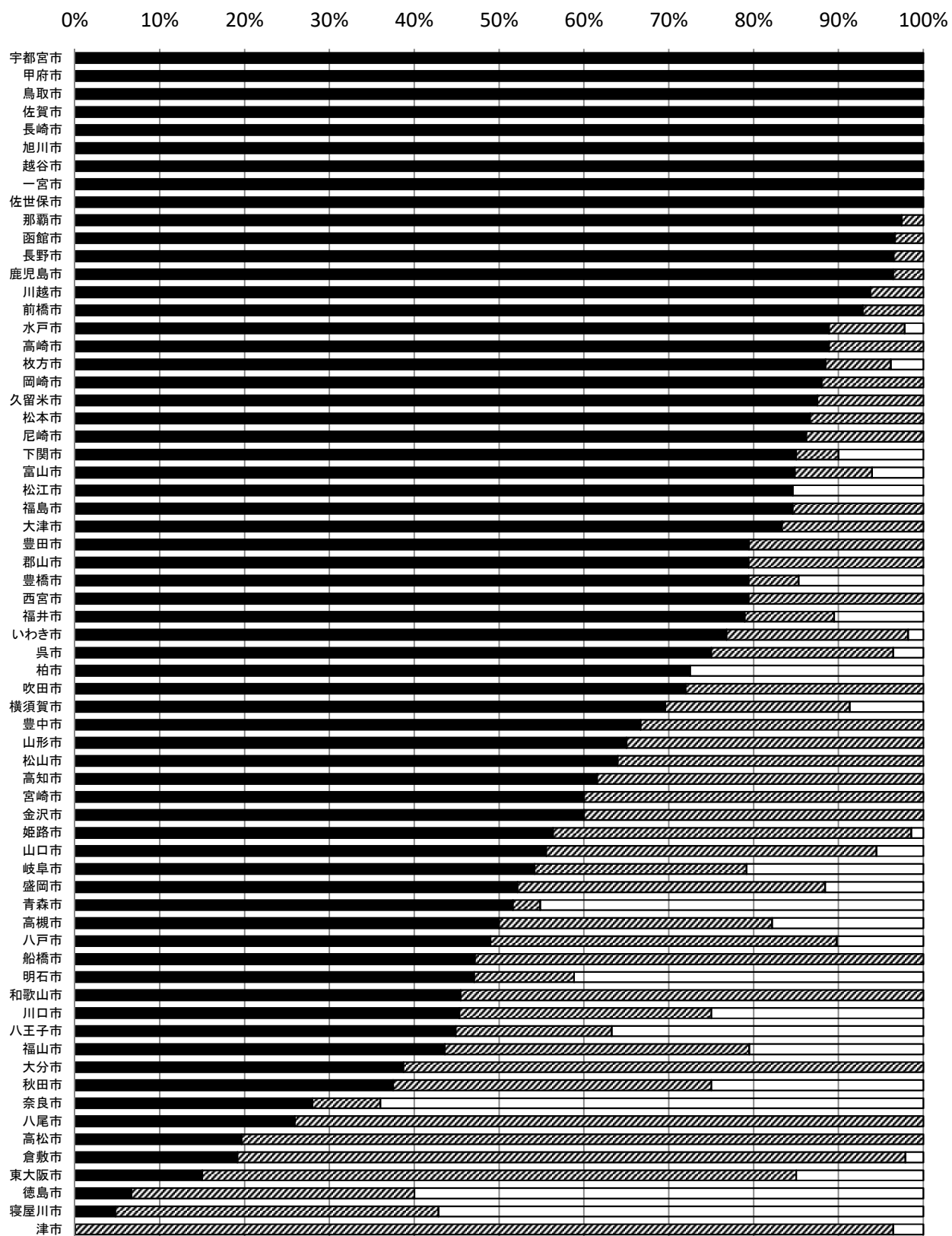
【2021年度 中核市・県庁所在地市落札率分布表(談合疑惑度順)】

■【談合疑惑度】落札率90%以上 ▨ 落札率85%以上90%未満 □ 落札率85%未満